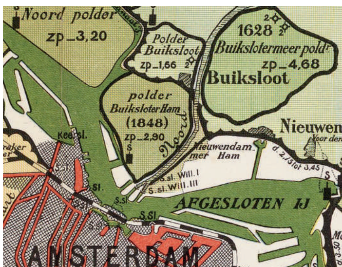
Polderkaart van W.H. Hoekwater uit 1901

Het W.H. Vliegenbos, aangelegd tussen 1912 en 1917, ligt evenals volkstuincomplex Buitenzorg en tuindorp Vogeldorp in de Nieuwendammerham - ooit open water en deel uitmakend van het IJ, dat in de tweede helft van de 19e eeuw is ingepolderd.