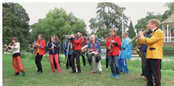
Straatorkest Toeters & Bellen.

We organiseren een feestelijke opening (met activering van de fontein) middels een ceremonie voor buurtbewoners, passanten, direct betrokkenen enz. (zie hierboven).