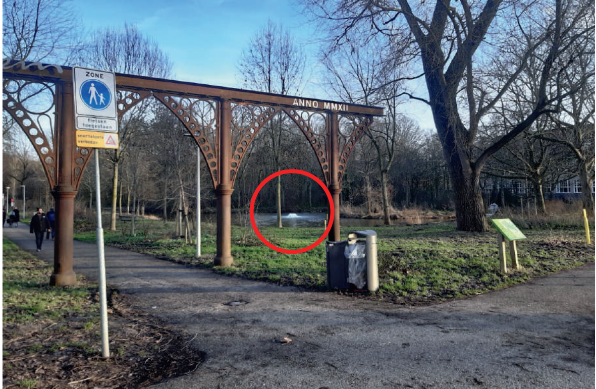
De vijver met daarin de huidige vijverpomp in het Vliegenbos, gezien vanaf de 'hoofdingang' aan de Meeuwenlaan.

De vijver aan het begin van het Vliegenbos, bij de ingang aan de Meeuwenlaan, naast de bogen uit de voormalige Hallen van Parijs. Zie foto's hieronder.