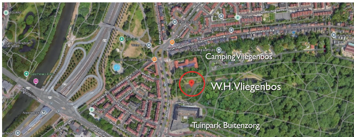
Roodomcirkeld de locatie van de fontein.

De gieters in het kunstwerk zijn grotendeels gevonden en ingezameld in Amsterdam Noord, onder meer op en in samenwerking met volkstuintenpark Buitenzorg. Ze staan symbool voor tuinieren en het zorgen voor de natuur, en hebben zo een sterke relatie met niet alleen de volkstuinten van Buitenzorg zelf maar ook de traditie van tuinieren in het naastgelegen tuindorp Vogeldorp en Amsterdam Noord als geheel (er zijn meerdere tuindorpen in Amsterdam Noord). Zo brengt Watering the Water deze elementen - het belang van water in de geschiedenis van de buurt, en tuinieren - samen op een speelse manier.