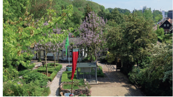
Algemene tuin en verenigingsgebouw van Tuinpark Buitenzorg, met links de hoge bomen van het Vliegenbos en rechts 'tuindorp' Vogeldorp.

Tuinpark Buitenzorg , opgericht in 1917 en inmiddels het oudste, niet-verplaatste volkstuintencomplex van Amsterdam, is gelegen pal naast het Vliegenbos. Het tuinpark is een belangrijke plek in de Vogelbuurt, als ecologische en biodiverse oase in Amsterdam en een sociale ontmoetingsplek voor buurtbewoners, natuur- en cultuurliefhebbers en, uiteraard, de volkstuinters.