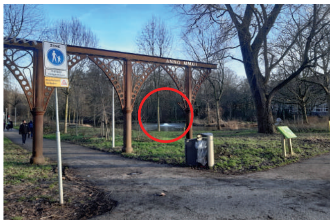
De vijver met daarin de huidige vijverpomp (rood omcirkeld) in het Vliegenbos, gezien vanaf de 'hoofdingang' aan de Meeuwenlaan.

De vijver aan het begin van het Vliegenbos, bij de ingang aan de Meeuwenlaan, naast de bogen uit de voormalige Hallen van Parijs. Zie foto hiernaast.