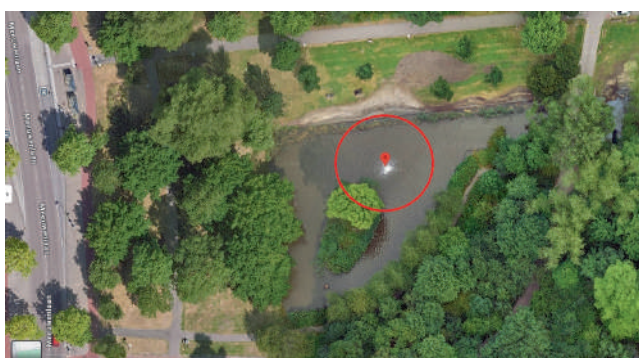
Roodomcirkeld de locatie van de fontein.