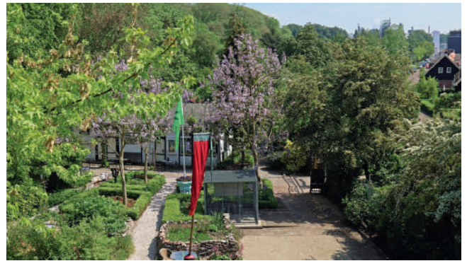
Algemene tuin en verenigingsgebouw van Tuinpark Buitenzorg, met links de hoge bomen van het Vliegenbos en rechts 'tuindorp' Vogeldorp.

De gieters staan symbool voor tuinieren en het zorgen voor de natuur, en hebben zo een sterke relatie met niet alleen de volkstuintuinen van Buitenzorg zelf maar ook de traditie van tuinieren in het naastgelegen tuindorp Vogeldorp en Amsterdam Noord als geheel (er zijn meerdere tuindorpen in Amsterdam Noord). Zo brengt Watering the Water deze elementen - het belang van water in de geschiedenis van de buurt, en tuinieren - samen op een speelse manier.